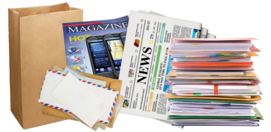
Correo de propaganda, publicaciones periódicas y papel de oficina (bolsas de papel, sobres y catálogos)