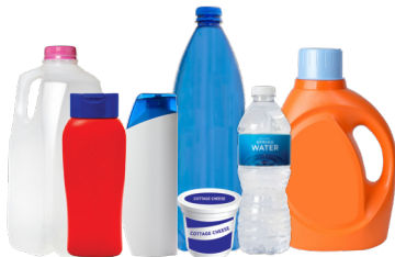
Botellas de plástico, jarras, cubo y tapas (cocina vacía, lavandería y recipientes de baño)