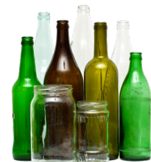
Botellas y frascos de vidrio (botellas y frascos vacíos de alimentos y bebidas)