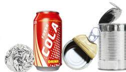
Latas de aluminio y acero (aluminio y latas de alimentos y bebidas de envase vacías)